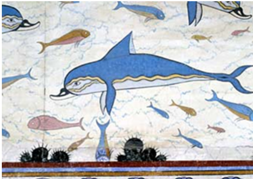
Photographie de Chris Johnson [19]

Il existe de nombreux mythes sur les dauphins, car ils ont fait l'objet d'un intérêt constant de la part des êtres humains pendant de nombreuses années. Dès la Grèce antique, une fresque de dauphins peinte dans le bâtiment des bains du palais de Cnossos témoigne de l'admiration des hommes pour les dauphins et de la nécessité de la perpétuer.