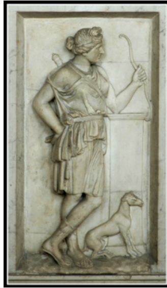
Artemis & Dog. Roman copy of the 1st cent. CE after a Greek original, 4th cent. BCE. Rome, Vatican Museums.

Le processus de domestication a conduit au développement de liens affectifs entre les humains et les chiens. En s'adaptant à l'environnement humain, les chiens sont devenus sensibles aux émotions humaines et ont appris à répondre aux signaux humains. Des études ont montré que l'interaction entre le chien et l'homme est mutuellement bénéfique, car elle entraîne une augmentation de la production d'hormone ocytocine - favorisant les liens sociaux et contribuant au bien-être général - tout en diminuant le cortisol, l'hormone du stress[35].