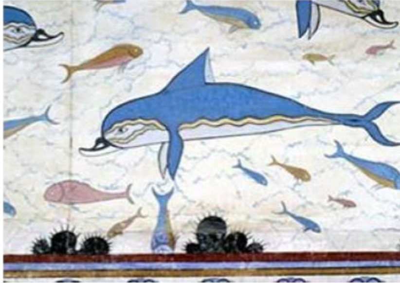
Chris Johnson fotografie [19]

Deze belangstelling is echter nooit vervaagd, want de laatste jaren zijn er zoveel dolfinaria, themaparken en andere instellingen die zich bezighouden met deze verbazingwekkende en gevoelige dieren. Het is niet alleen leuk om dolfijnen onder de hoede van mensen te hebben, het is ook een enorme verantwoordelijkheid om hun natuurlijke gedrag te verhogen en te stimuleren, constant te werken aan milieuverrijkende programma's, etc. Terugkomend op het BUSTA-project en de democratische vaardigheden is het belangrijk om te weten waarom dolfijnen zulke unieke dieren zijn. Iedereen die geïnteresseerd is in het leven van dolfijnen kan zeker veel informatie vinden over het feit dat dolfijnen unieke en intelligente dieren zijn. Ten eerste zorgt alleen al de fysiologische uniciteit ervoor dat we glimlachen als we naar de dolfijn kijken, omdat we de open mond van een dolfijn associëren met zijn glimlach. Ten tweede zijn deze dieren eindeloos nieuwsgierig, dat kun je alleen al zien bij een bezoek aan het dolfijntherapiecentrum.